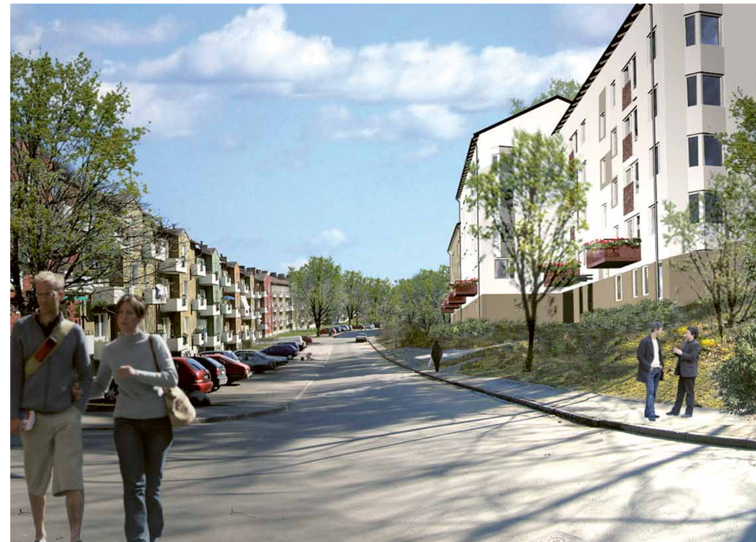
⚡Veidekkes flerbostadshus TellHus i Kvarteret Ytterskär i Stockholm, som vid denna broschyrs pressläggning är under produktion.