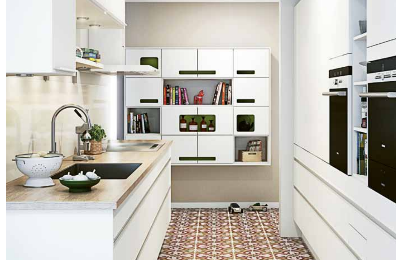
⤴ Det Svanenmärkta köket "Grappa vit/Gallery" från Marbodol.

En annan fördel med Svanenmärkta produkter är att de håller hög kvalitet. Svanen kräver ofta funktions- och hållbarhetstester. Detta gäller exempelvis för golv, fönster, byggskivor, värmekällor, vitvaror, köks- och badrumsinredning. Dessutom vet alltid den som köper en Svanenmärkt produkt att den är tillverkad med så stor hänsyn till miljön som möjligt.