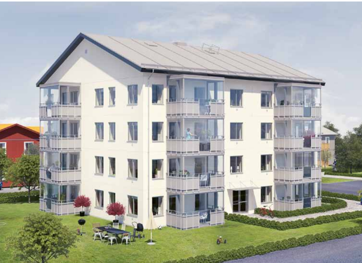
Skanskas flerbostadshus ModernaHus i Kvarteret Stationsmästaren i Söderköping, som vid denna broschyrs pressläggning är under produktion.